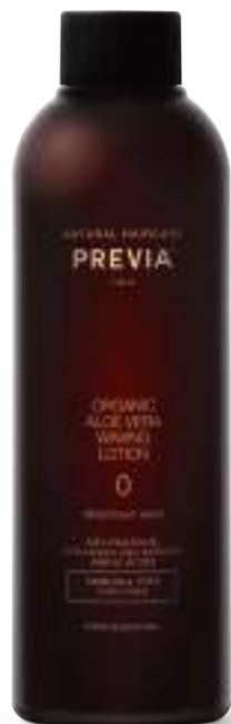
0. RESISTANT HAIR PER CAPELLI RESISTENTI.