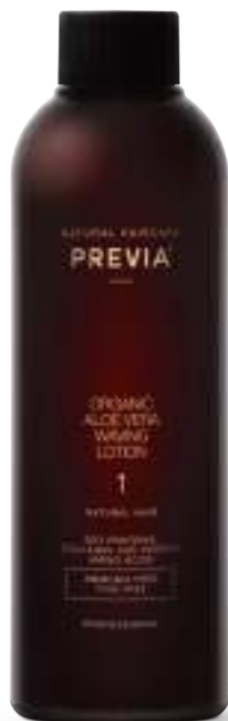
1. NATURAL HAIR PER CAPELLI NATURALI.