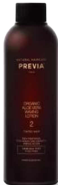
2. TINTED HAIR PER CAPELLI TINTI.